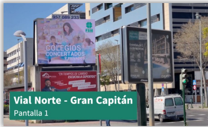
Vial Norte - Gran Capitán Pantalla 1