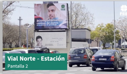
Vial Norte - Estación Pantalla 2