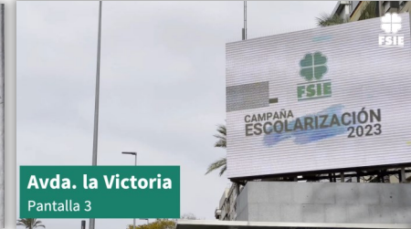
Avda. la Victoria Pantalla 3