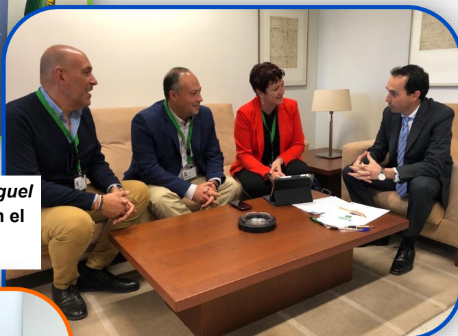
FSIE- A durante la reunión mantenida con Miguel Ángel Ruiz , (Portavoz de Educación del PP en el Parlamento).